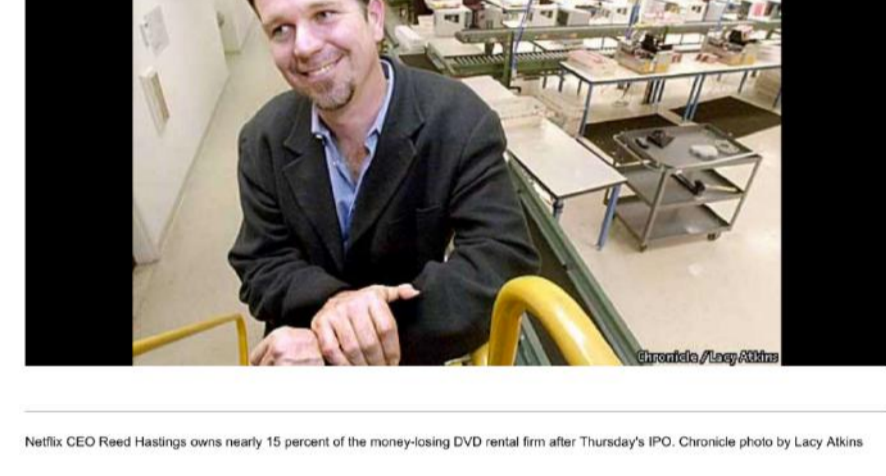
Netflix CEO Reed Hastings owns 15 percent of the money-losing DVD rental firm after Thursday's IPO.