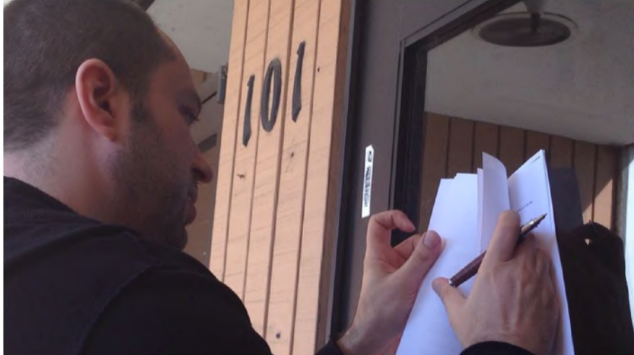
Jan Koum signs the $19 billion Facebook deal paperwork on the door of his old welfare office in Mountain View, Calif.

2月，每天短信处理量达到 20 亿条 3月，上线“ Send place ”功能；上线“ Group Icon ”功能 8月，每天短信处理量达到 100 亿条